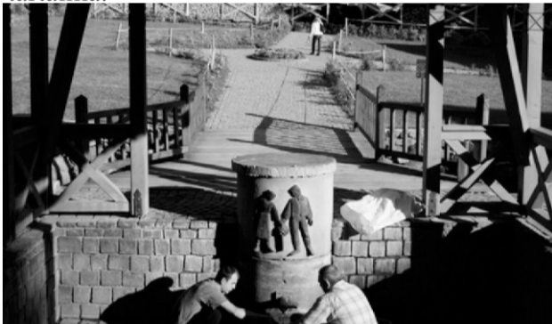
Habár a borvíz ereje az elmúlt 15 évben

A XIX. században indul fejlődésnek a kis falu, amikor a borvízforrásokat köpübe foglalják, valamint sétányokat és zenepavilonokat építenek. Mai napig is található még köpübe torkoló borvízforrás Homoródfürdőn, a nagyobb források körül utólag építettek tetőzeteket, majd körbebetonozták és csövek segítségével vezették ki a borvizet a földből. A település közel 200 évig Kápolnásfalu fürdőtelepe volt, 1913-ban kerül be csak a helynévtárba. A fürdőtelepnek tizenkét borvízforrása van, ezeknek nagyon magas a vas-tartalma.