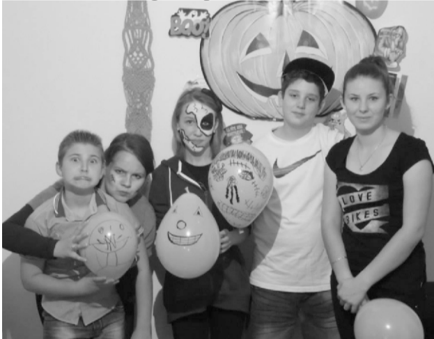
Töklámpát készítettünk, zenét hallgat-

A fiatalok sem maradtak le az októberi rendezvényekről, ugyanis 26-án az ifjúsági együleten a manapság oly felkapott amerikai ünnepet a Halloweent megünnepeltük.