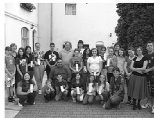
A táborozó „nagycsapat”