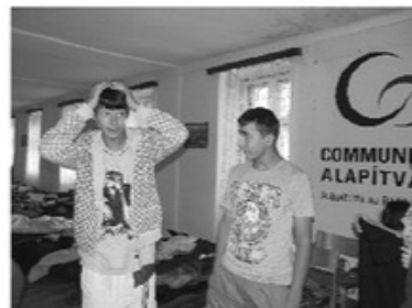
Támogatónk a COMMUNITAS ALAPÍTVÁNY