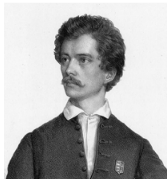
Medgyes, 1849. március 2 - 3.

Ropog, hosszan ropog Csatárok fegyvere, Ágyúk bömbölnek, hogy Reng a világ bele; Te ég, te föld, talán Most összeomlotok! Előre, katonák, Előre, magyarok!